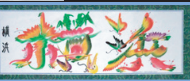
中国伝統文藝